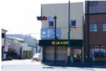
【編】ここから先は「御城」の外です。

〈箱根口交差点付近 MAP⑤〉箱根口門（旧大手門）を出るといよいよ町場。にぎやかな声がかえってきますね（想像力の問題です）。箱根の入り口「箱根口」、京都を目指す旅人はぞろりの緒を惹き締めます。江戸時代には4つの本陣が立ち並び、多くの大店が軒を連ねる日本屈指の宿場町でした。