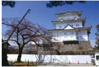
【編】取材当日はまだオープン前でした。

〈小田原城本丸 MAP①〉何れともあれ本丸・天守閣でしょう！めでたく5月1日よりリニューアル open の天守閣。改めて市民なら一度は見えておきましょうね。かつての城主にならって最上層「摩利支天」のお参りも忘れずに。