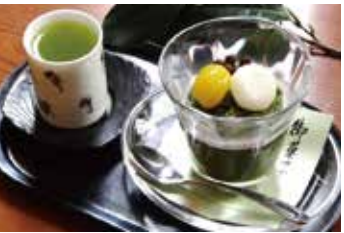
【編】期間限定の抹茶はふえ「すずかぜ」は、税抜600円。

〈ういろ MAP⑩〉全国的に有名な「ういろ」の自家本元がここ！何しろ歴史が室町時代からですから。店構も「八棟造り」と呼ばれる独特な姿。明治以降残る蔵が外部博物館になっていて、職人気質を感じさせる歴史ある品々を展示。（入館無料ガイド付き）